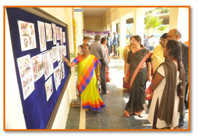
Chair Person observing Dept. of Zoology Notice Board