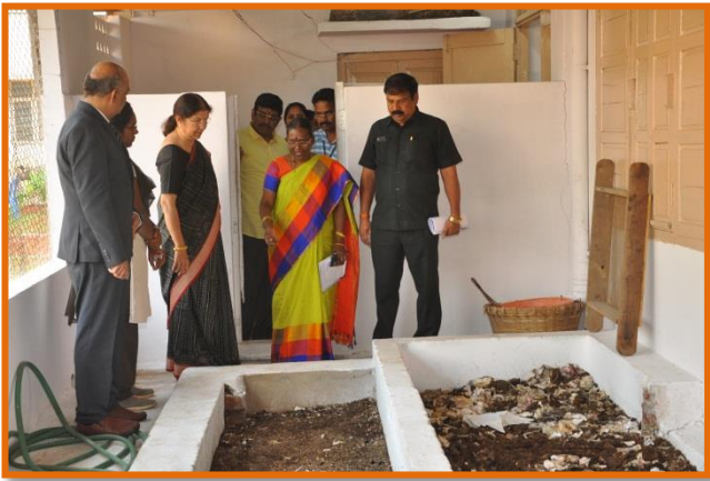
At Vermi Compost Bed