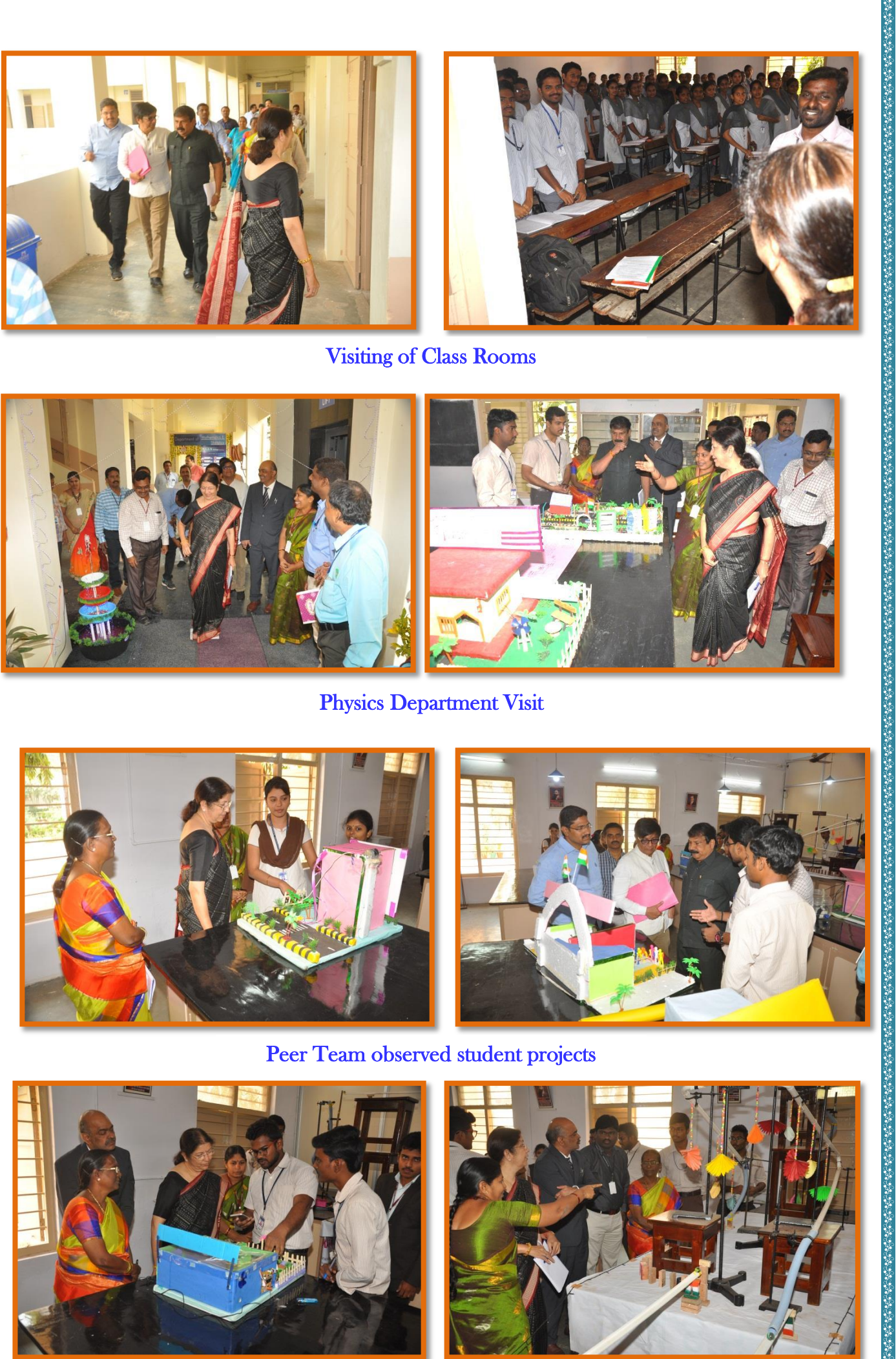
Peer Team observed student projects