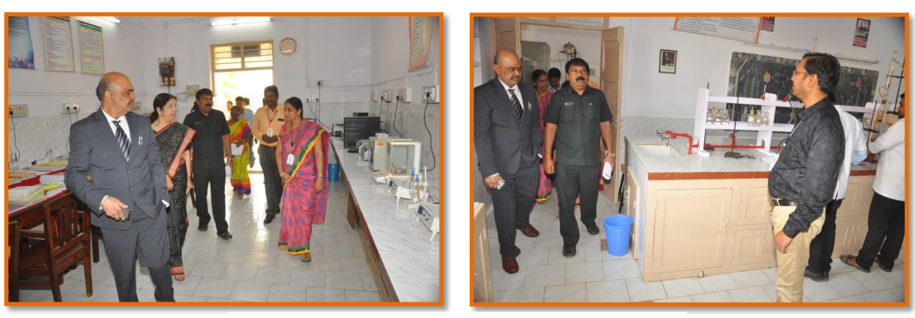
Dept. of PG Chemistry Visit