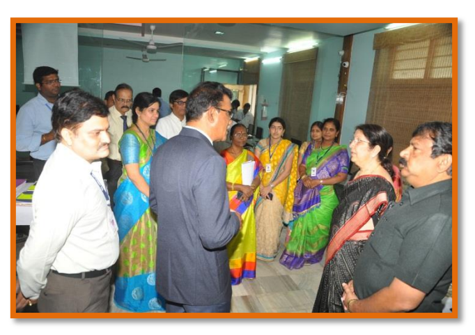
Interaction of Peer Team with MBA Staff