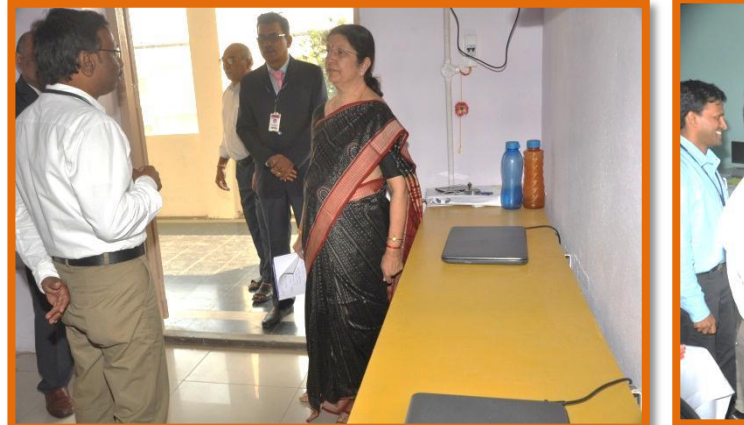
Placement & Guidance Cell