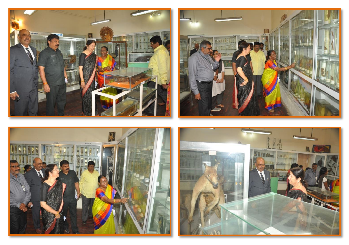
Peer Team in Zoology Museum