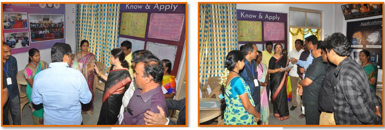
Maths Lab Visit