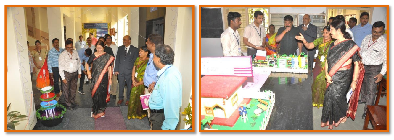
Physics Department Visit