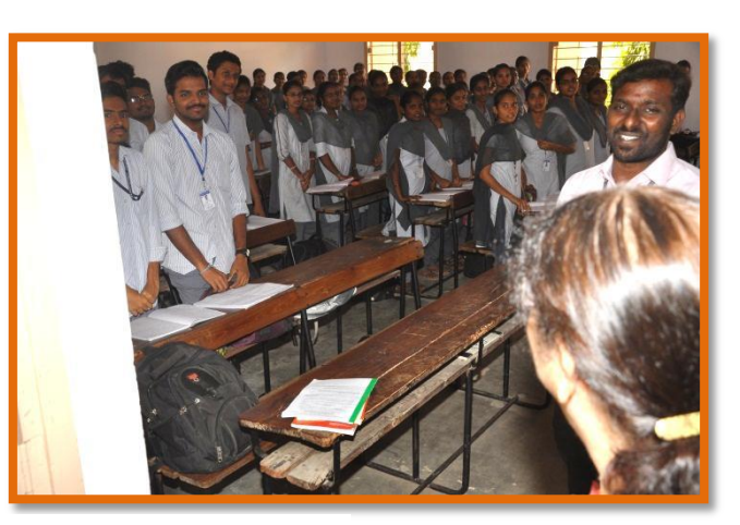
Visiting of Class Rooms