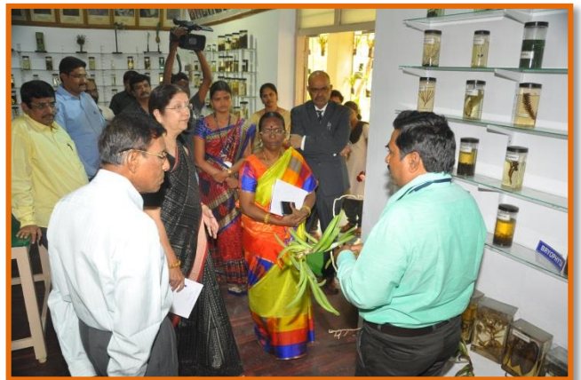
Peer team at Botany Museum