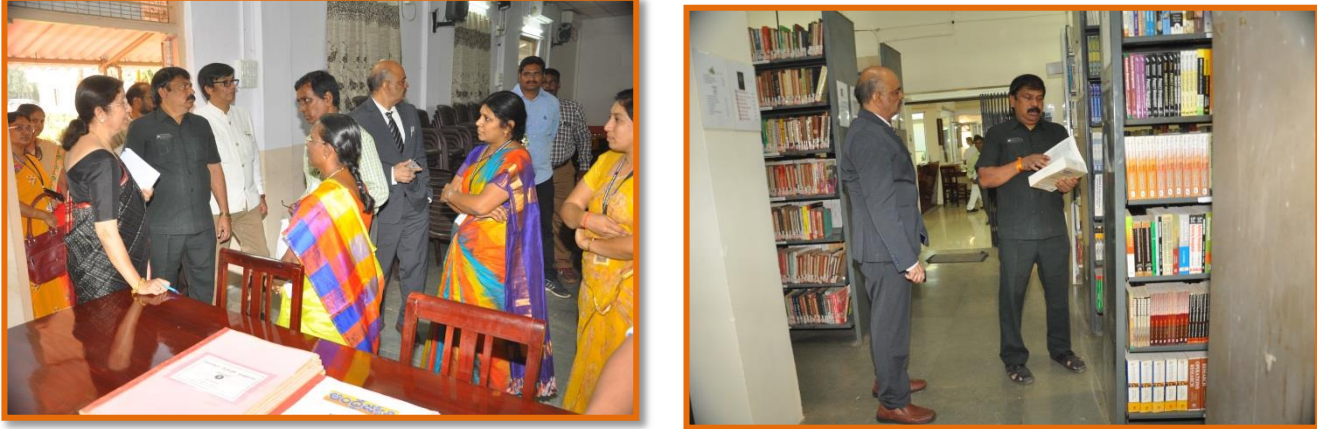
Visiting of UG library