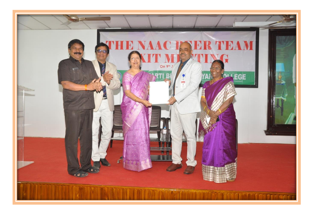
Peer Team Suggestions Report submitted to Principal